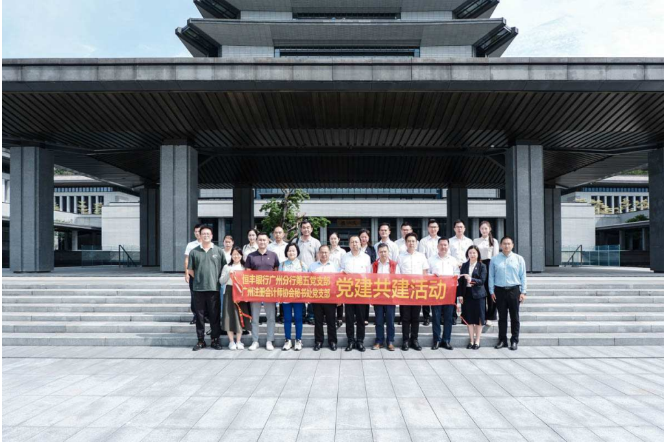
广州注册会计师协会 2024年5月13日