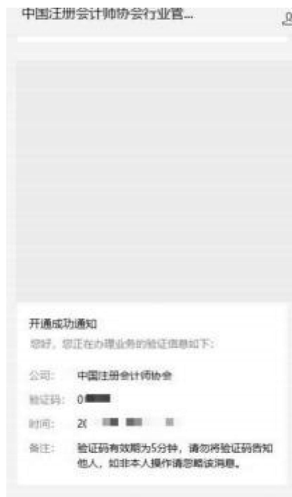
2-2 微信公众号验证码接收界面

2、个人会员在验证码接收界面点击获取验证码，验证码会发送到绑定的“中国注册会计师协会行业管理系统”微信公众号上。填写验证码后点击【下一步】跳转到新密码设置界面。