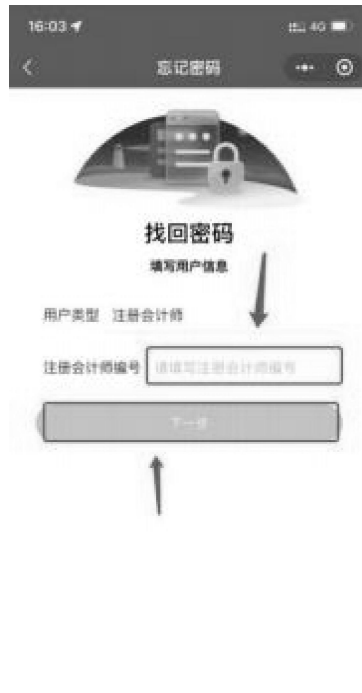
1-4 会员编号填写界面