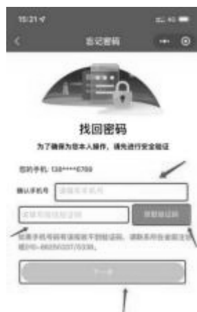
1-6 手机号验证码验证界面

2、填入完整的手机号码，点击获取验证码并输入验证码后点击【下一步】跳转到新密码设置界面。