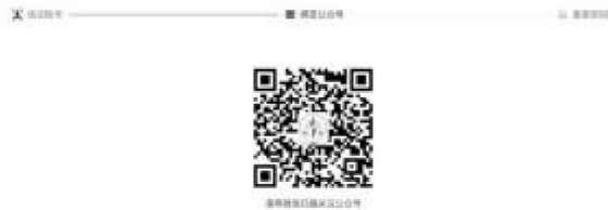
2-7 中国注册会计师协会行业管理信息系统公众号二维码界面

4、个人会员已绑定公众号时会展示验证码接收界面。点击发送验证码可将修改密码验证信息发送到公众号上。个人会员可通过公众号查看验证码，输入验证码后点击【下一步】跳转至新密码设置界面。