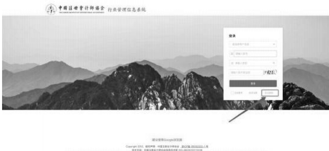
2-5 年检系统登陆界面