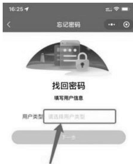
1-3 用户类型选择界面