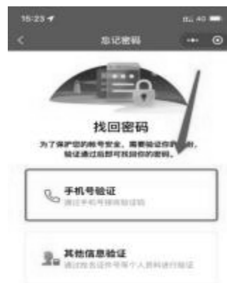
1-5 选择手机号验证界面

1、个人会员在信息验证时会员信息中留有正确手机号，可以通过手机号接收验证码方式找回密码。