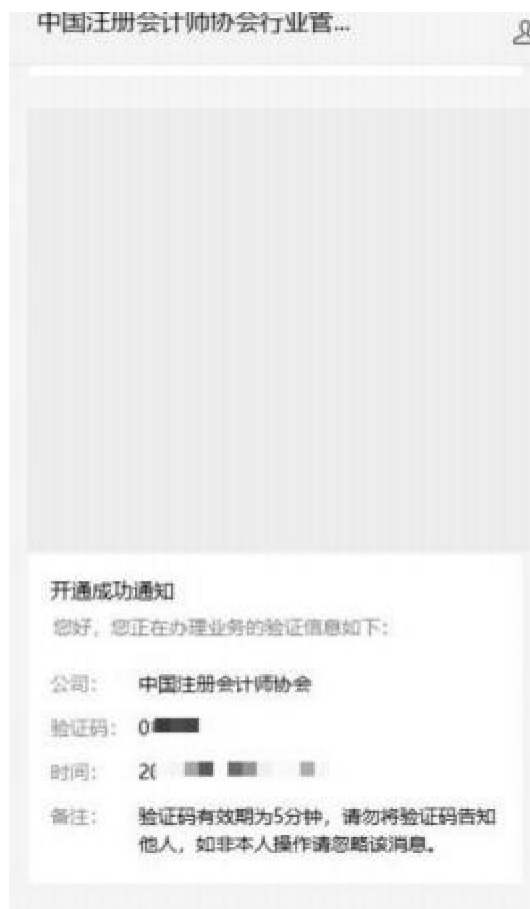
2-8 微信公众号接收验证码界面

4、个人会员已绑定公众号时会展示验证码接收界面。点击发送验证码可将修改密码验证信息发送到公众号上。个人会员可通过公众号查看验证码，输入验证码后点击【下一步】跳转至新密码设置界面。