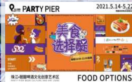
啤酒+美食 珠江·琶醍“美食选择醒”