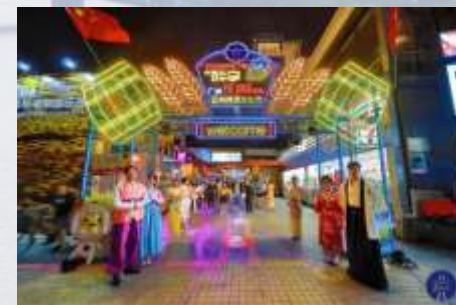
啤酒+文化 广州亚洲美食节暨“醉享花城”-广州亚洲啤酒文化节