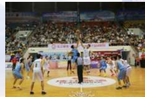
啤酒+体育 珠江啤酒·广东省男子篮球联赛