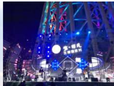
啤酒+音乐 珠江纯生啤酒派对

珠江啤酒拥有7家高新技术企业，拥有国家认定企业技术中心、博士后科研工作站、国家认可实验室，20多项技术填补国内空白，是全国轻工行业先进集团、中国酿酒行业十强企业。荣获全国文明单位、国家环境友好企业、广东省先进基层党组织等殊荣，品牌价值位列中国百强，品牌价值提升至188亿元，享有“南有珠江”美誉。