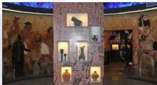
珠江-英博 国际啤酒博物馆