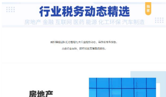
每季度七大行业重要动态汇编