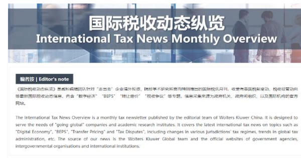
每月分主题汇总国际税收动态