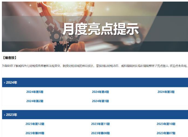
每月汇总推荐财税库更新及亮点

随着行业飞速发展、法律法规和准则标准的变化调整、商业模式的推陈出新等，无不对会计师事务所执业人士的专业知识和能力水平提出全新挑战和更高要求。及时关注财税动态，不仅有助于展现事务所专业能力，还可以为客户提供政策动态的增值服务，提升客户体验。