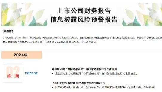
每季度汇总监管信息和案例