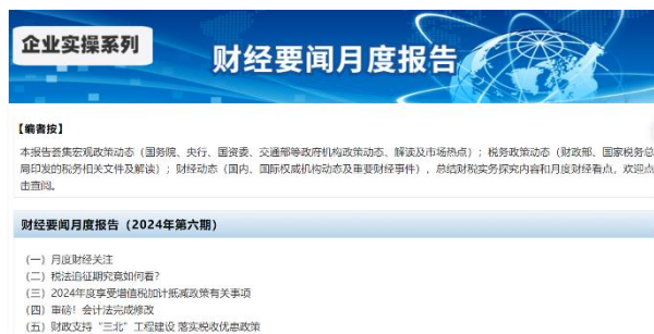
每月汇总重要政策要点解析